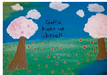
Tabea, 13 Jahre