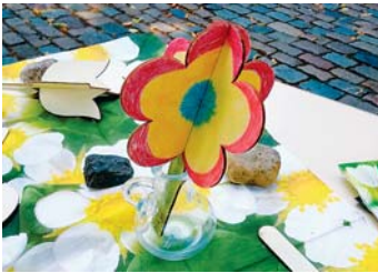
Gemalt und fotografiert: Vivien und Nico

Die Kinder haben vorgesorgt und haben schon im vergangenen Jahr die immer wiederkehrende Blütenpracht gemalt. Vielleicht merkt auch jemand, dass die farbenfrohen Blumen zum Denkmaltag 2020 entstanden sind. Die Bilder hingen von November 2020 bis Januar 2021 in der Friedenskirche. Aber leider war es nicht so recht möglich, die Bilder dort zu bewundern. Und darum erscheinen einige der gemalten Blumen im Weinstock, in zwei Ausgaben. Im Weinstock Heft Nr. 80 sind einige Bilder vom Denkmaltag, von einigen Konfirmanden und von den Christenlehrekindern veröffentlicht und im Weinstock Nr. 81 sind Bilder der Kobolde und Wichtel aus dem Kindergarten Traumhaus in Grünau zu sehen. Alle Bilder kommen auf die Homepage.